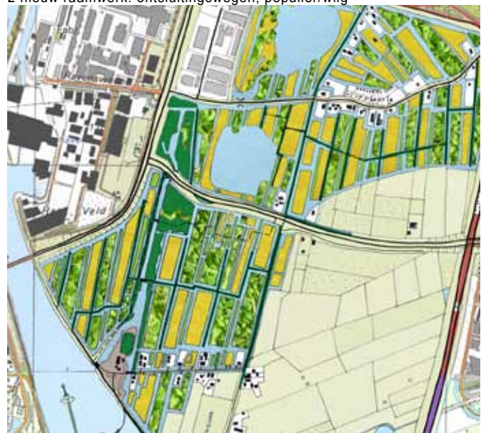
4 beplanting: riet, griend, hakhout