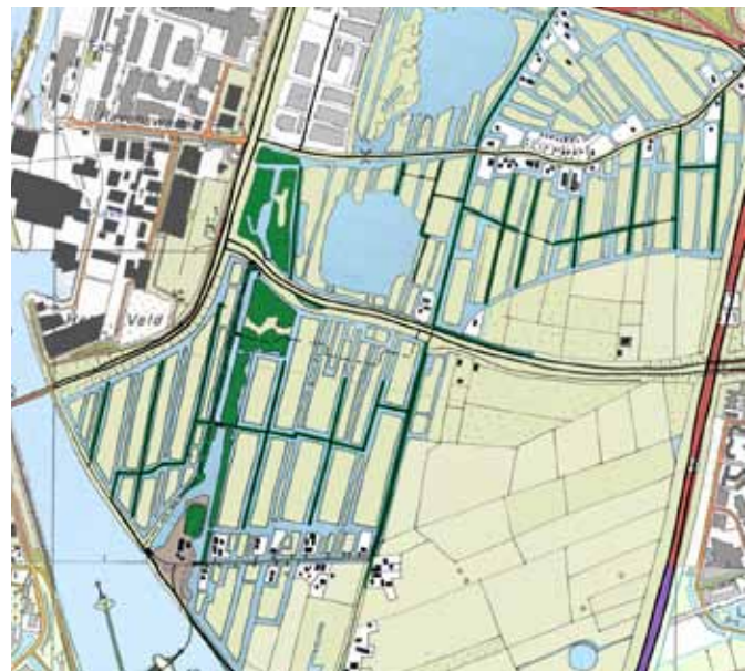
2 nieuw raamwerk: ontsluitingswegen, populier/wilg