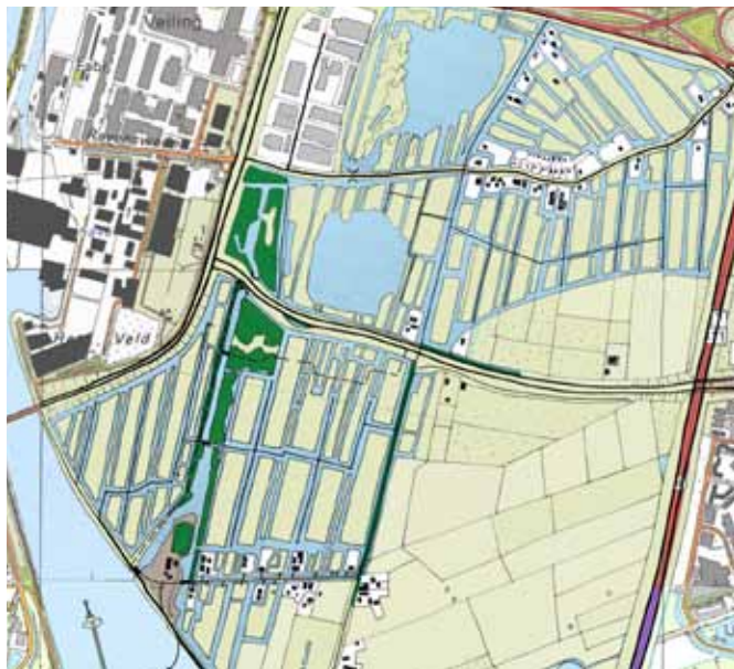
1 netwerk watergangen: kavels worden 'eilanden'