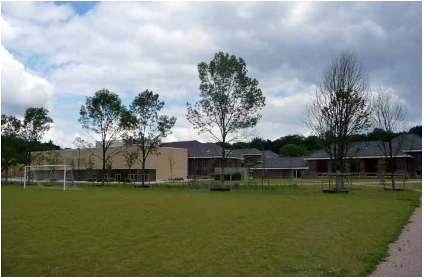
Compositie kazernegebouwen, nieuwbouw en sportvelden