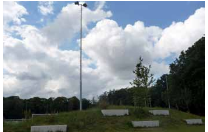
Tribune bij ateliekbau