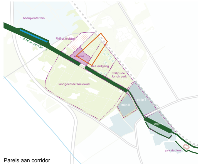
Parels aan corridor