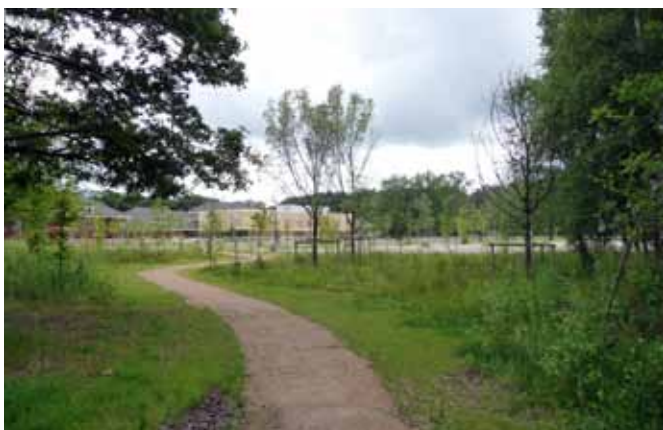
Bestaand bos aangevuld met nieuwe bomen