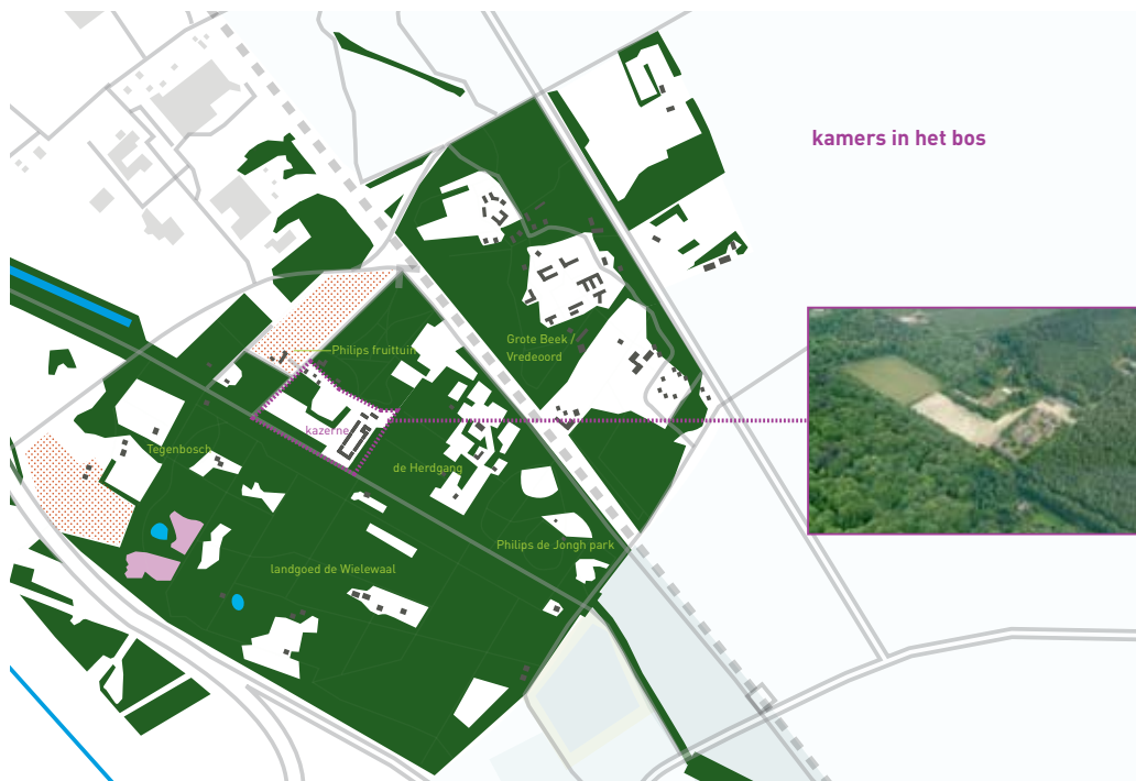
kamers in het bos

Het vooroorlogse concept van de Constant Rebeque Kazerne in Eindhoven was als militair complex gericht op orde en tucht, rangen en standen. Redelijk ver verwijderd van de stad, functioneerde de hiërarchische mannenwereld in beslotenheid en afzondering van de samenleving. Nu de kazerne niet langer als zodanig wordt gebruikt, wordt het gebouwencomplex en het omringende terrein getransformeerd tot de Internationale School Eindhoven (ISE). De typische kazernesfeer maakt plaats voor een hedendaags en bruisend schoolterrein en -gebouw waarin gastvrijheid, vriendschap, ontmoeting, improvisatie, participatie en het ISE-onderwijsconcept tot bloei komen. Het multidisciplinaire ontwerpteam maakte hiertoe een integraal plan. Kernbegrip van het ontwerp is verbinding: verbinding tussen landschappelijke kamers, tussen architectuur en landschap, verbinding tussen mensen. Buro Lubbers stond in voor het landschappelijke deel en de inrichting van de buitenruimte.