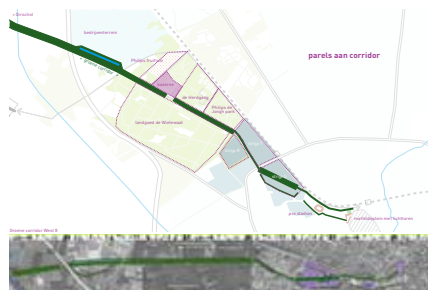
parels aan corridor

Het vooroorlogse concept van de Constant Rebeque Kazerne in Eindhoven was als militair complex gericht op orde en tucht, rangen en standen. Redelijk ver verwijderd van de stad, functioneerde de hiërarchische mannenwereld in beslotenheid en afzondering van de samenleving. Nu de kazerne niet langer als zodanig wordt gebruikt, wordt het gebouwencomplex en het omringende terrein getransformeerd tot de Internationale School Eindhoven (ISE). De typische kazernesfeer maakt plaats voor een hedendaags en bruisend schoolterrein en -gebouw waarin gastvrijheid, vriendschap, ontmoeting, improvisatie, participatie en het ISE-onderwijsconcept tot bloei komen. Het multidisciplinaire ontwerpteam maakte hiertoe een integraal plan. Kernbegrip van het ontwerp is verbinding: verbinding tussen landschappelijke kamers, tussen architectuur en landschap, verbinding tussen mensen. Buro Lubbers stond in voor het landschappelijke deel en de inrichting van de buitenruimte.