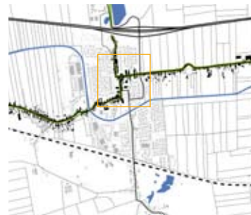
A59 en uitbreiding Waspik