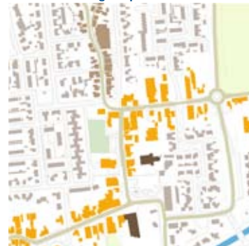
2010: Dorpsplein, Schoutstraat, uitbreiding

Het dorpsplein van Waspik wordt zowel een groene, prettige verblijfs- en ontmoetingsplek als een plek waar evenementen kunnen worden gehouden en kan worden geparkeerd. Dat is de ambitie van het ontwerp dat Buro Lubbers voor het plein maakte.