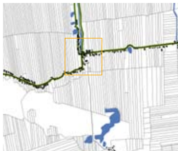
Slagenlandschap met dijklint (Langstraat)