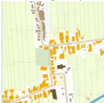
1960: katholieke kerk, park, verdichting lint