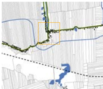
Zuidelijk afwateringskanaal en spoor