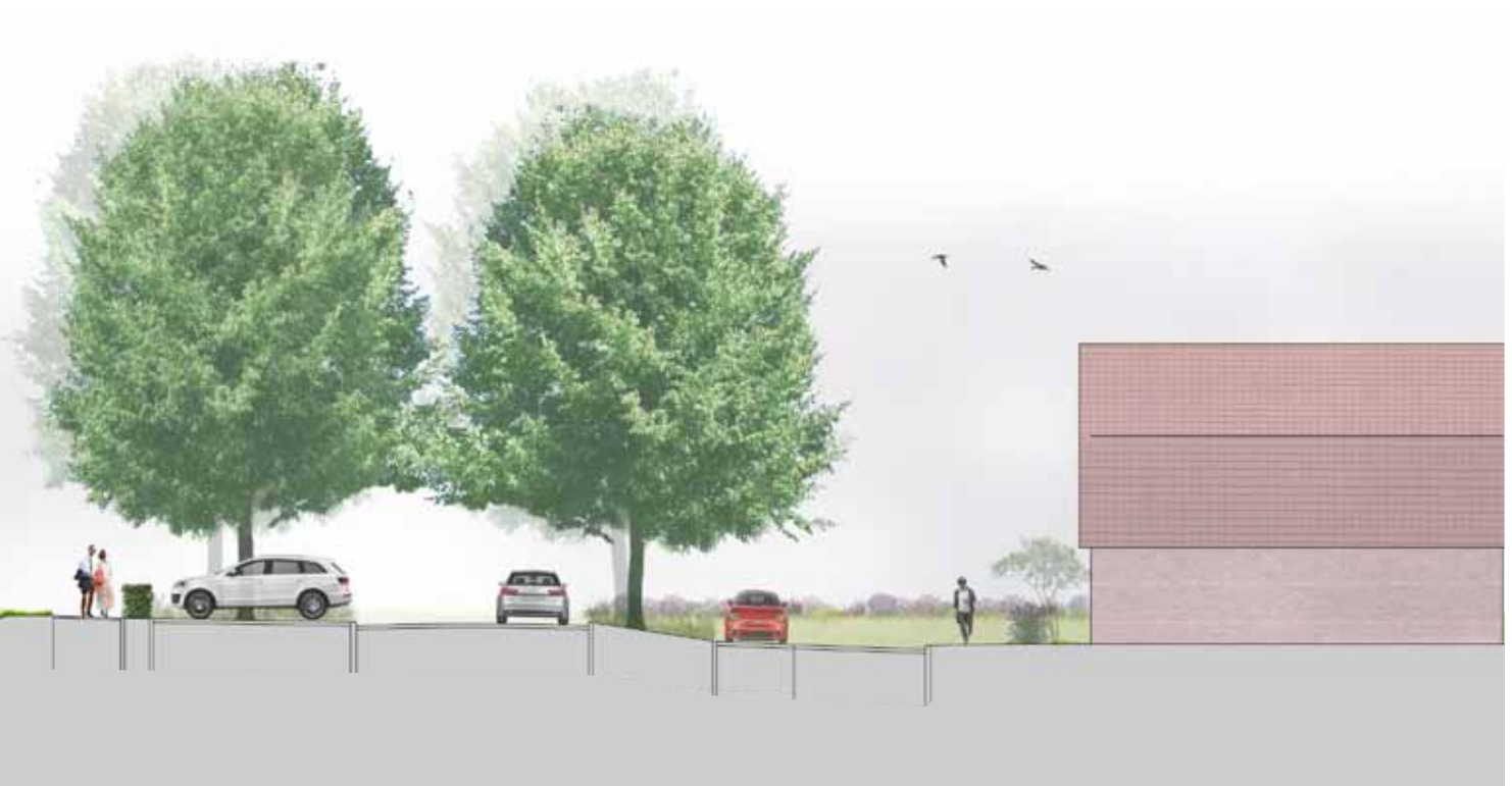
Toekomstig beeld Stadhouderslaan brede bermen, parkeerplaatsen, lindenbomen