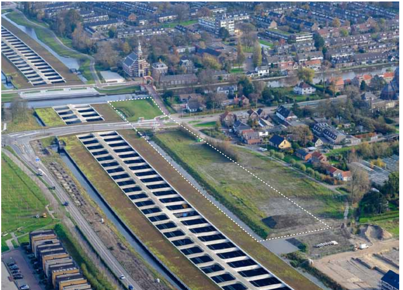
huidige situatie verdiepte A4 aan zijde van Hoge Rijndijk