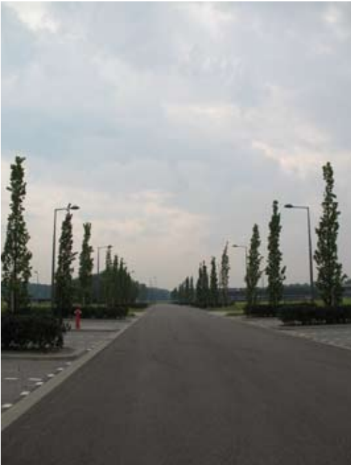
groene plinten zuidzijde

Bedrijvenpark te midden van groen en water, aan de rand van de snelweg