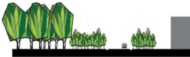
principe noordzijde versterken en beleefbaar maken landschapselementen