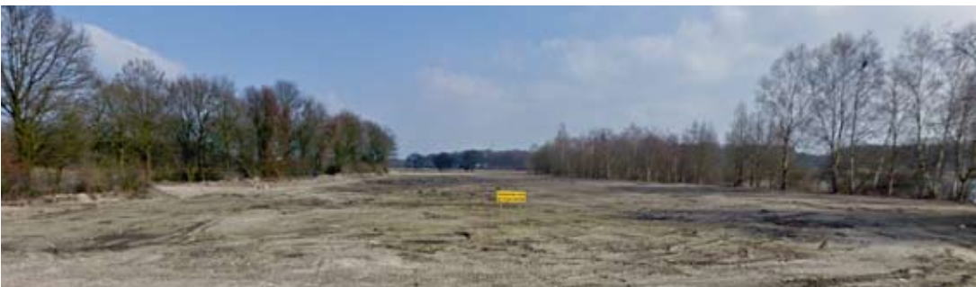
noordzijde nog onder constructie

De herkenbare beeldkwaliteit van T58 en de landschappelijke inbedding blijken aantrekkelijk voor ondernemers gezien de aanmeldingen voor vestiging sinds 2005. Het aanstellen van een parkmanager voor het beheer en onderhoud van de openbare ruimte onderstreept de waardering van de bedrijven voor de toplocatie aan de snelweg A58, te midden van water en groen.