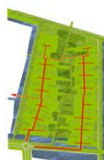
facet routing auto's