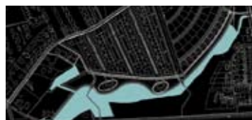
waterstanden natte- droge periodes