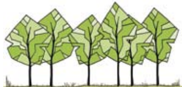
bomengroei fase 3