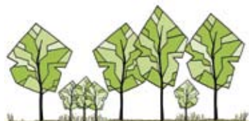
bomengroei fase 4