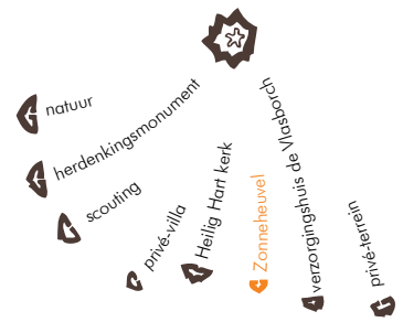
huidige functies lunetten