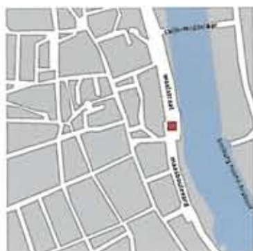
lugar de encuentro junto al río meuse en Cuijk meeting place next to meuse river in Cuijk

La zona del muelle es la primera fase de un proyecto urbano y de paisaje llevado a cabo por Buro Lubbers en Cuijk. En próximas fases la iglesia, la plaza del museo y el cementerio, entre otras cosas, se rediseñarán y se realizará un plan que defina la calidad de imagen de las viviendas en el Maasboulevard.