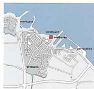
objetos robustos para el paisaje de zeeland sturdy objects for zeeland's landscape