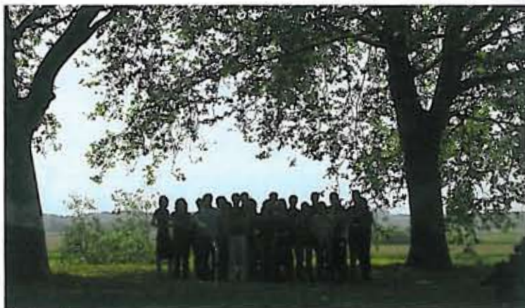
"The image of our team is like a silhouette to show that we work as a collective."

■ Every new assignment is reduced to its essentials and approached in relation to its environment: the genius loci. The design is based on a coherent and strong environmental framework, which leaves room for effortless adaptations in time. Whether it is a landscape or urban assignment the studio aspires a green image; the green structure being the basis of the plan.