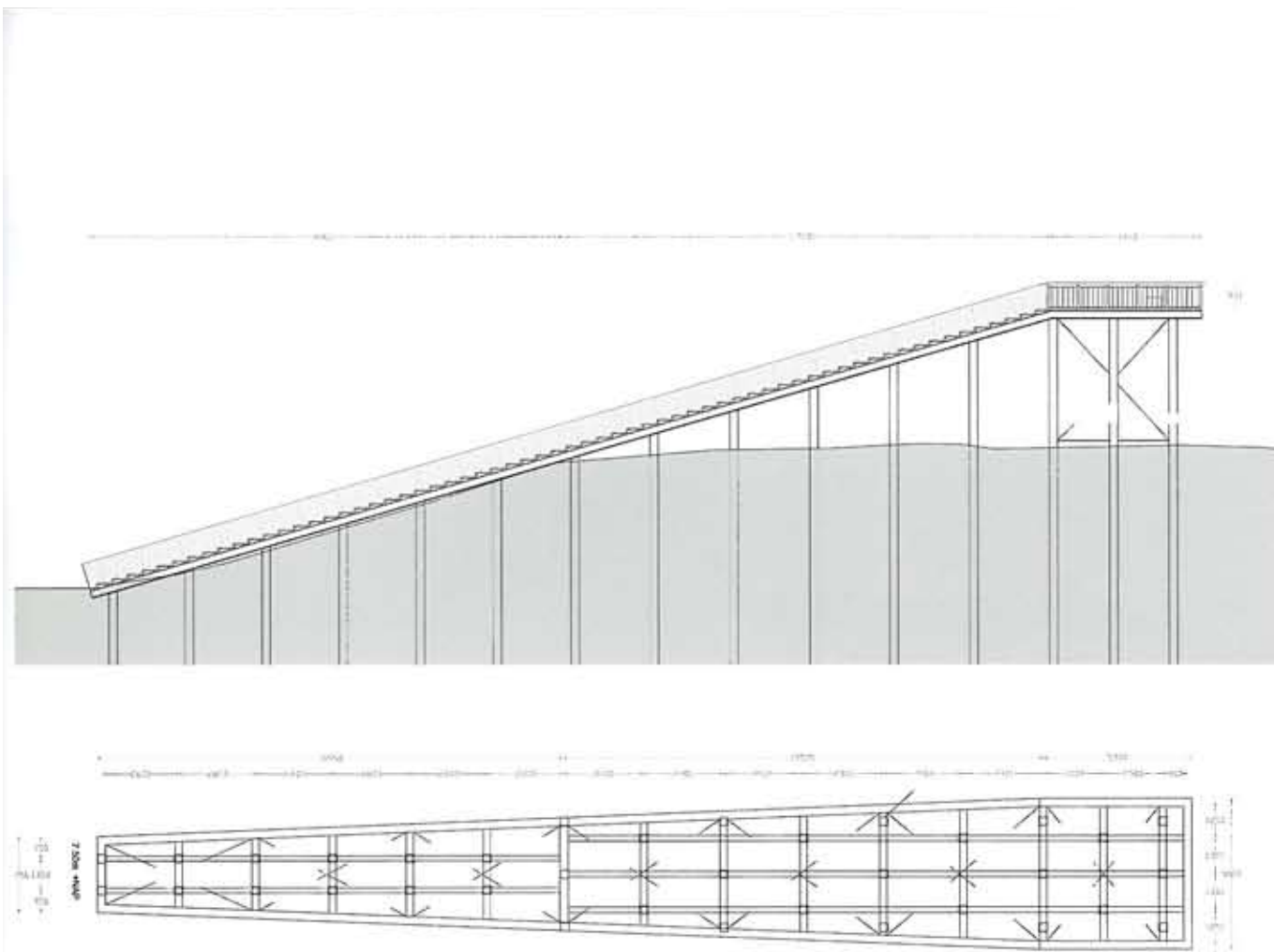
detalle terraza panorámica panorama terrace detail