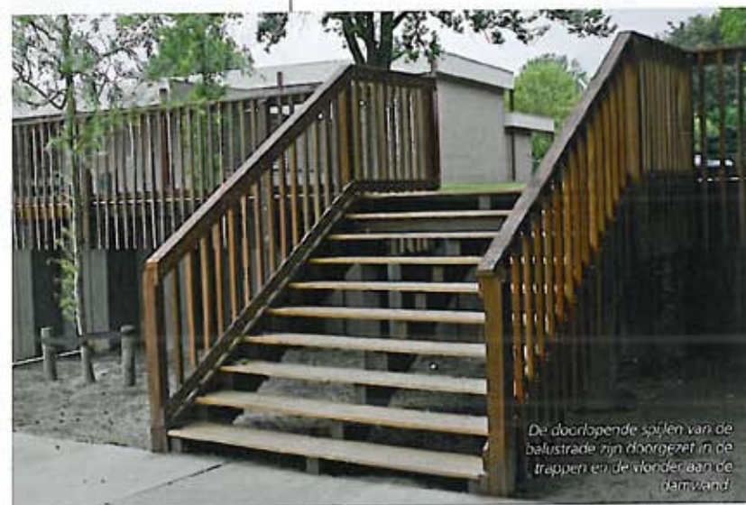
De doorlopende spijlen van de balustrade zijn doorgezet in de trappen en de vloer aan de damwand.