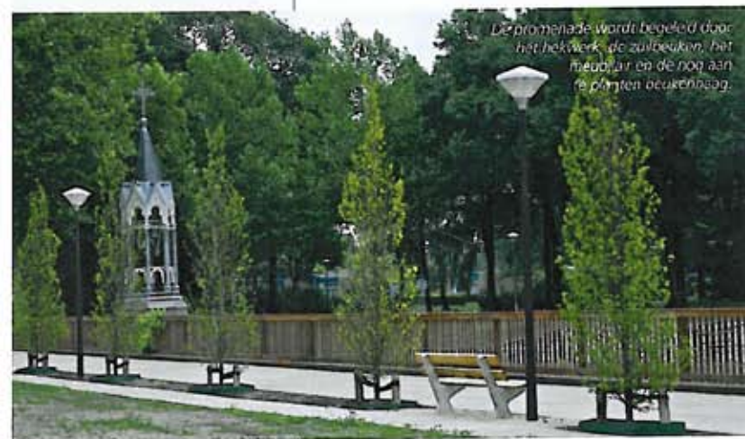
De promenade wordt bepleid door het hekwerk, de zalbeuken, het meubilair en de nog aan te planten beukenhaag.