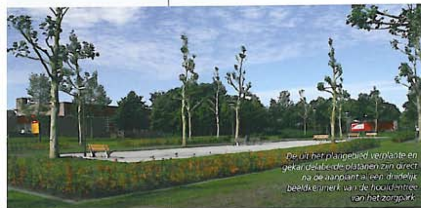
De uit het plangebied verplante en gekandelerende platanen zijn direct na de aanplant al een duidelijk beeldkenmerk van de hoofdentree van het zorgpark.

Soms worden bestaande landschappelijke elementen versterkt, bijvoorbeeld door de oude beuken- en eikenlanen aan te zetten met wandelpaden. Soms worden nieuwe landschappelijke elementen toegevoegd, zoals de waterpartij aan de Parklaan. Alle ruimtelijke ontwikkelingen worden evenwel gerelateerd aan drie hoofdassen: een voorzieningenas, een woonas en een verbindingsas. Als de belangrijkste dragers van het landschappelijk raamwerk dienen de hoofdassen als kapstok voor kleinere ingrepen en bouwplannen die later worden gerealiseerd. Hiermee is een gefaseerde ontwikkeling van Zorgpark Voorburg mogelijk.