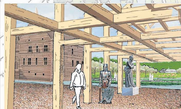
Het verleden van kasteel Schaesberg moet stapsgewijs weer toekomst krijgen

dig voor het eerherstel van het kasteel zelf. Maar voor de naastgelegen hoeve. Op de fundamenten van de slothoeve wordt volgend jaar een houtengeraamte geplaatst. Uiteraard geheel volgens de vroegere bouwstijl. Uitpluiskwerk voor wetenschappers van diverse universiteiten in binnen- en buitenland. In die hoeve woonden vroeger de heren van de kasteelheer. „De hoeve was daarom de economische spil van het landgoed en Buro Lub-