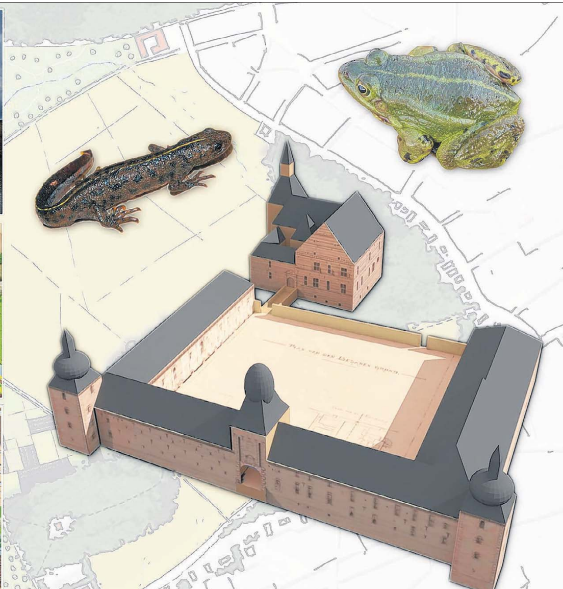
met dit renovatieplan.