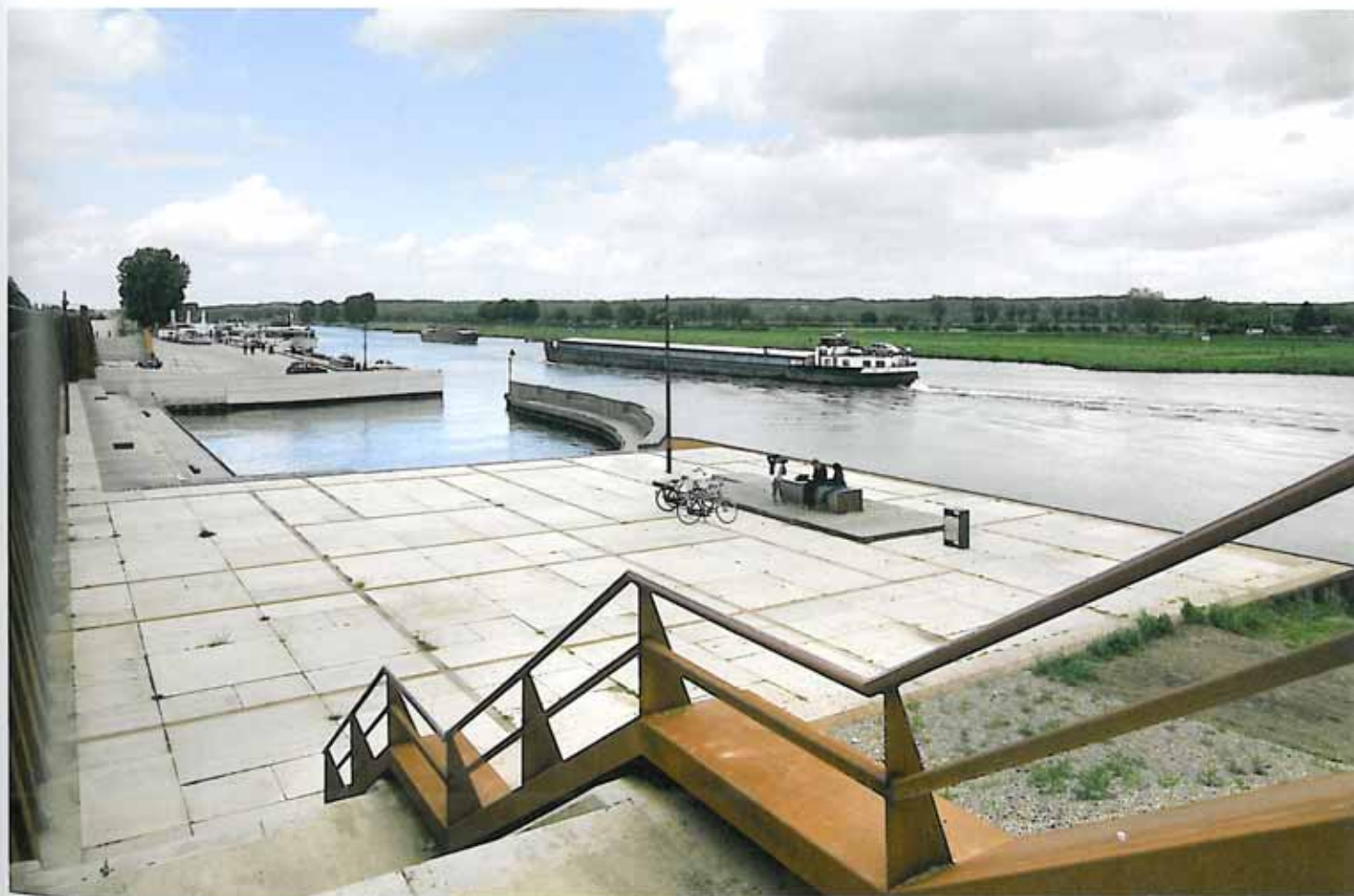
| Doorsnede van het ontwerp. | Zicht over het haventje, in de richting van de heuvels bij Mook.