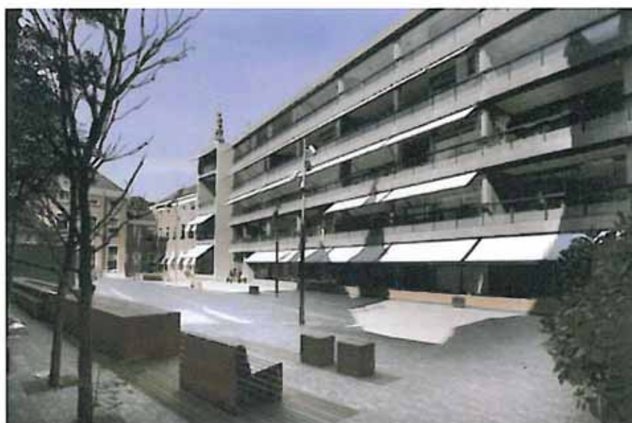
Met zijn ontwerp voor het binnenpleintje achter de Choorstraat heeft Buro Lubbers de Nederlandse Designprijs 2004 gewonnen.