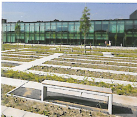
Tuin na aanleg in 2008