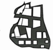
Raamwerk vs kamers

Voorburg is een park met diverse gespecialiseerde gezondheidszorginstellingen voor cliënten met psychische, psychiatrische en/of psychosociale problematiek. Voor een deel van de cliënten is contact met de open samenleving noodzakelijk om isolement te voorkomen; voor een ander deel kan de samenleving een bedreiging vormen. Het masterplan voorziet