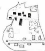
Voorzieningen vs behandelen vs wonen