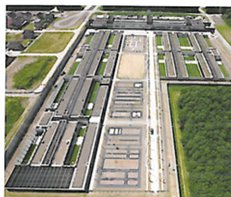
Landschap en Estaf. Deel 1, 2008

esplanade om te wandelen wordt aangevuld met zitbankjes en een pingongtafel. De buitenruimten (patio's, moestuin) kunnen de patiënten in overleg met de tuintherapeute beplanten. In de toekomst worden op het terrein ook kassen en dierenverblijven gerealiseerd. Op deze manier sluit het humane ontwerp aan op het gedifferentieerde en multifunctionele zorgprogramma van de Oostvaarderskliniek.