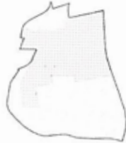
Openbaar park vs opengesteld landgoed