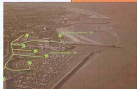
Ligging elementen aan de Looplijn.

facts locatie: Breskens ontwerp: Buro Lubbers landschaps- architectuur & stedelijk ontwerp Peter Lubbers, Marian de Vries, Caroline de Feijter, Roy Wouters opdrachtgever: Gemeente Sluis, projectleider Tiny Maenhout aannemer: Aquavia Sas van Gent constructeur: Vissers Ingenieursbureau Venlo-Blerick (Panora- materras) ontwerp: augustus 2004 (Utkijkvlonder) en augustus 2005 (Panoramateras) uitvoering: voorjaar 2005 (Utkijkvlonder) en voorjaar 2006 (Panoramateras) bijzonderheden: uit- kijkvlonder geselec- teerd voor Nederland- se Designprijzen 2005 en panoramaterras genomineerd voor Deutsche Designpreise 2007